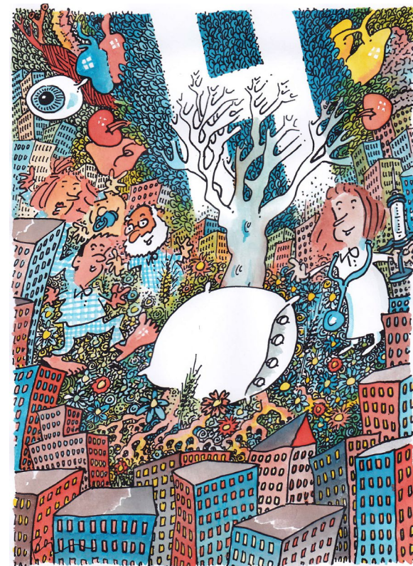
Dessin signé Pécub, dessinateur et philosophe

AULA DE L'HÔPITAL DE SION MARDI 4 AVRIL 2023 À 17H